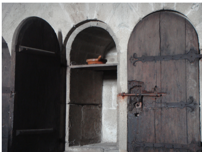
Eglise d'Obazine, deux niches de pierre et leurs rayonnages