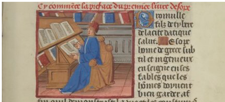
Paris, BnF, Smith-Lesouëf 68, f. 27 (Esopo écrivant)

Seules peuvent nous guider les indications topographiques et matérielles des inventaires anciens, quand elles existent, et les lieux conservés ou leurs traces archéologiques. Alors, en quoi la reconstitution virtuelle d'une bibliothèque ancienne, en particulier médiévale, peut-elle consister, et comment concevons-nous aujourd'hui les bibliothèques virtuelles ?