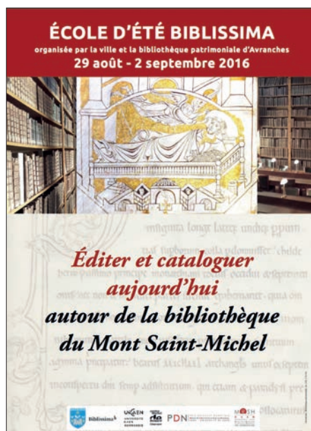
▲ L'école d'été Biblissima organisée en 2016 par la BM et la Ville d'Avranches, le CRAHAM et la MRSH de Caen

avec un large corpus d'inventaires mauristes (IRHT) ; les inventaires anciens du Mont-Saint-Michel (CRAHAM) ; divers inventaires proposés par des collègues étrangers (Italie, Autriche, Islande...). THECAE a vocation à accueillir toute édition critique d'inventaire ancien, de façon à permettre des recherches sur l'ensemble des corpus. La collection accueillera également les répertoires d'inventaires (grecs et latins pour le moment), dont les notices sont les chapeaux introductifs des éditions actuelles et futures. Pour les éditions en cours, elle proposera un «laboratoire de textes», THECAE-Lab , accessible à tous mais sur login.