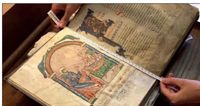
▲ Campagne de numérisation pour "La bibliothèque virtuelle du Mont Saint-Michel", financée en partie par Biblissima

Le portail Biblissima a été enrichi de manière graduelle avec de nouveaux jeux de données, traités et intégrés par vagues successives au cours de l'année 2017. Ce portail offre des