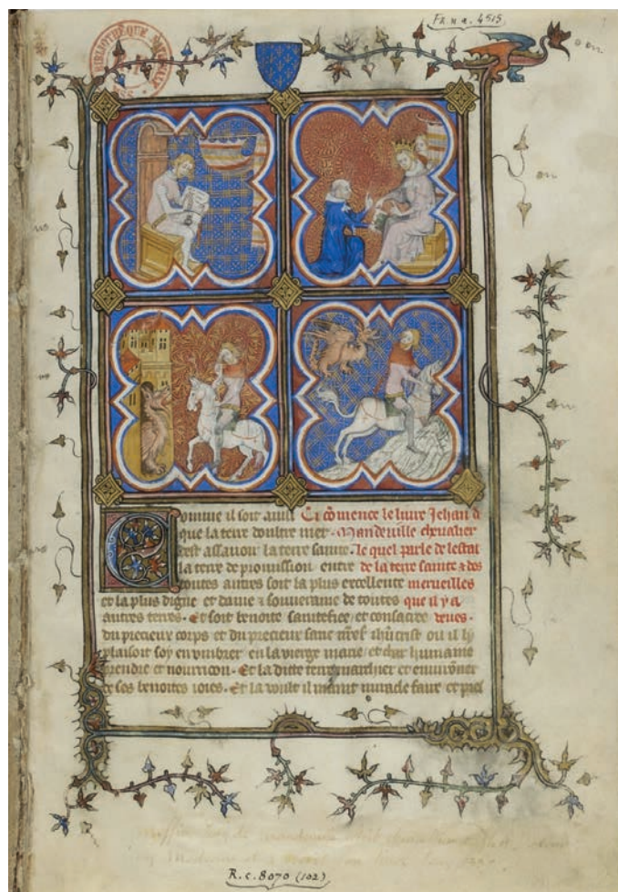
▲ Jean de Mandeville, Voyages ; Préservation de Epidémie , traduction française du De morbo epidemiae de Jean de Bourgogne. vol. I: Jean de Mandeville, Voyages (version continentale). Manuscrit (1371)